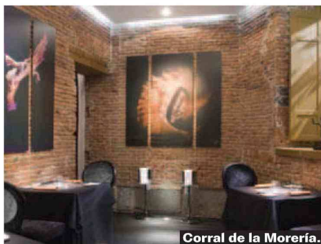
Corral de la Morería.