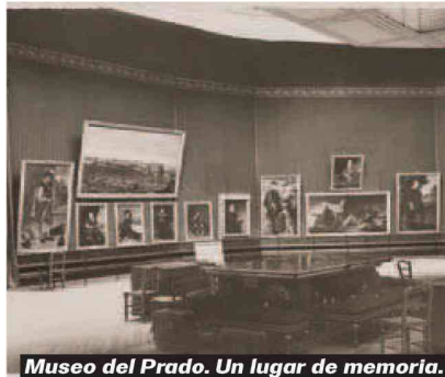
Museo del Prado. Un lugar de memoria.