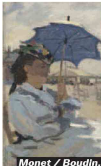
Monet / Boudin.